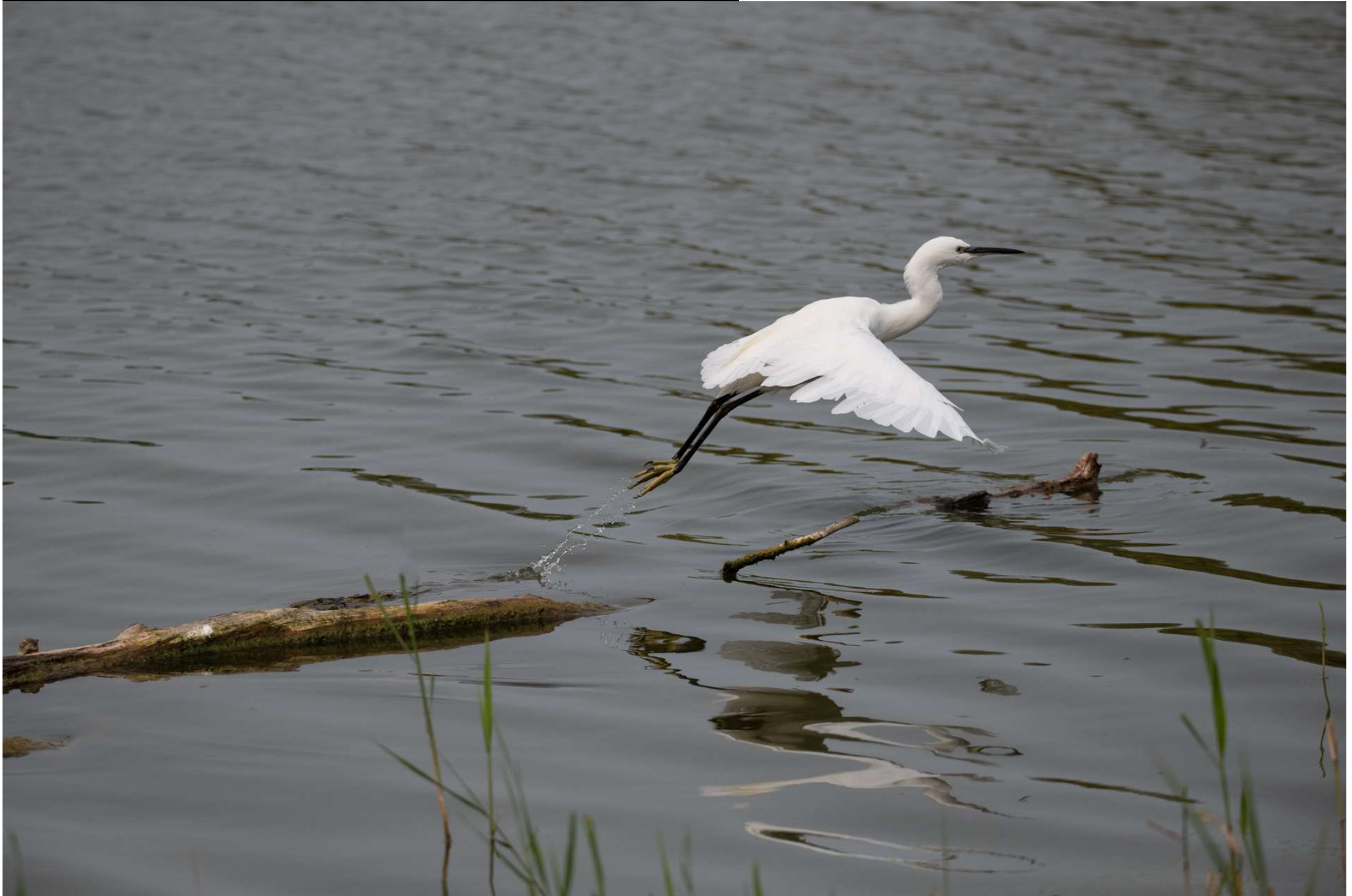
Aigrette garzette (Cambrin, août 2024)